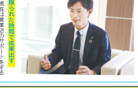
現在は営業店のサポートをするチームに所属しています。主にビジネスマッチングや補助金、iDeCo(個人型確定拠出年金)などについての営業店からの問い合わせに回答しています。

東京の会社に就職するが、宮崎に戻るかを結構ギリギリまで迷っていました。今振り返ると、他の企業よりも宮崎銀行の説明会やインターンが一番多く行っていたなと思います。大学3年生の夏に初めて当行のインターンに参加し、それから説明会や面接など人事の方と数多くお話しをするにつれて「ここで仕事をしたい」と強く思うようになりました。地元での就職を決めました。