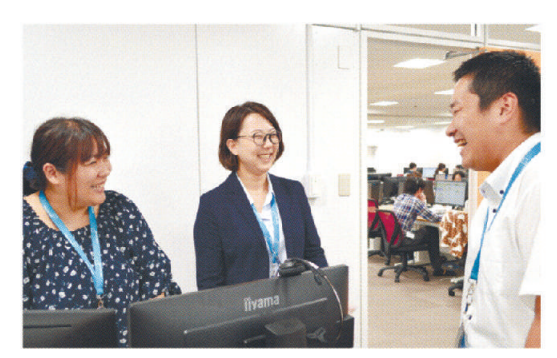
採用に貢献できるのが魅力で、管理職という立場での、スタッフの教育や仕事の割り振りなどをしながら、一人一人に目を配っています。仕事や生活で困っていることがないか、定期的に面談をしています。

ミス恐れずチャレンジを 大学卒業後、福岡県で働いていたのですが「宮崎でいろいろやってみよう」と思い、宮崎センターが設立された2015年に帰宮。派遣社員として働き始めたのが入社の日。入社して2カ月後に契約社員になり、それから1年後に正社員になりました。建築学が専門だったので、建築の仕事に就きたいと思っていました。が、当時は就職氷河期で、気持ちを切り替えて、やっとなかなかいい仕事をしてもらうと人材採用支援という業務を選びました。