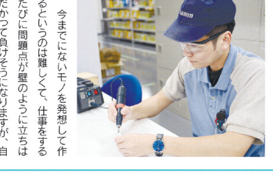
今までも「モノ」を発想して作るというのには難しくて、仕事をやるたびに問題点が壁のように立ちふさがって負けてしまうことがありますが、自分で考えたり調査したり、上司や先輩に相談したりしながら、それをどうにか解決していくときに達成感を感じ、やりがいを感じます。

大学院を卒業後、東京で仕事を1年間していたのですが、都会の喧騒といまは満員電車等が自分には合わないと思い宮崎へ帰って就職しようと思いました。宮崎の企業を調べていたときに、実家の近くに宮崎キャノンがあることを知り、さっそく調べてみると、技術の部署もあり、大学で大学院で知識を活かせるのではないかと思いました。世界遺産の番組などでもCMをしているキャノンブランドの仕事が「宮崎でできる」、都会にいても宮崎で世界最先端の仕事ができるのはすごいなと思い就職試験を受けました。